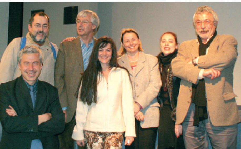
> Les membres de la Commission particulière du débat public.

Il a participé à l'équipe des cinq experts mandatés par les ministres de l'Environnement et des Transports pour organiser et conduire le débat public sur le projet du canal Rhin-Rhône, en 1996, et a suivi pour la CNDP le débat public recommandé CEDRA (CEA, Cadarache - 2001) et la concertation recommandée sur le projet de réacteur de fission nucléaire expérimental Jules Horowitz (CEA, Cadarache - 2005).